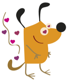
Celos y sangrado