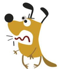
Mordeduras y peleas

+ Evita en las hembras tumores de mama, ovarios, útero, embarazos psicológicos, piómetra, mastitis, que se escape y se pierda.