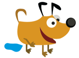
Marca de territorio